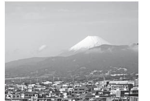
6階から見える富士山

6階フロアは、手術室と中央材料室があります。手術室は、4部屋あり、外科・整形外科・産婦人科・泌尿器科・脳神経外科・眼科の手術を合わせて、年間約1,700件行っています。看護師は12名で、看護部の中では一番少人数の部署になります。職場の運営方針に“患者様に、安全・安心・安楽な看護を提供する”を上げ、全員一丸となって日々の業務を行っています。